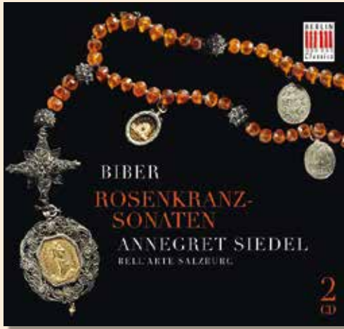
Heinrich Ignaz Franz Biber Rosenkranzsonaten 2013 BERLIN Classics 0300531BC