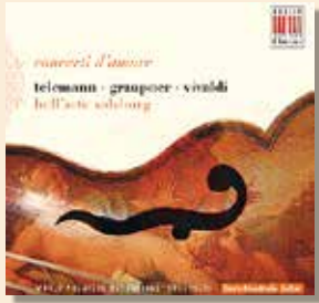
Concerti d'amore Telemann, Graupner, Vivaldi 2010 BERLIN Classics 0016712BC