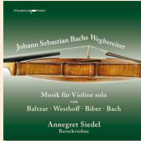
Johann Sebastian Bachs Wegbereiter – Musik für Violine solo Baltzar, Westhoff Biber und Bach (Partita d-Moll) 2019 musicaphon M 56984