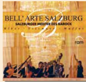
Salzburger Meister des Barock 1996 ram ram 59602