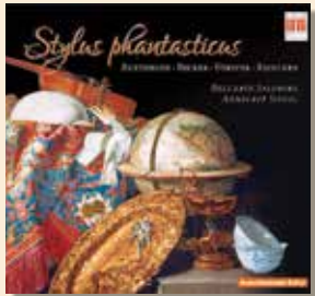
Stylus phantasticus in der norddeutschen Instrumentalmusik des 17. Jahrhunderts 2009 BERLIN Classics 0016572BC